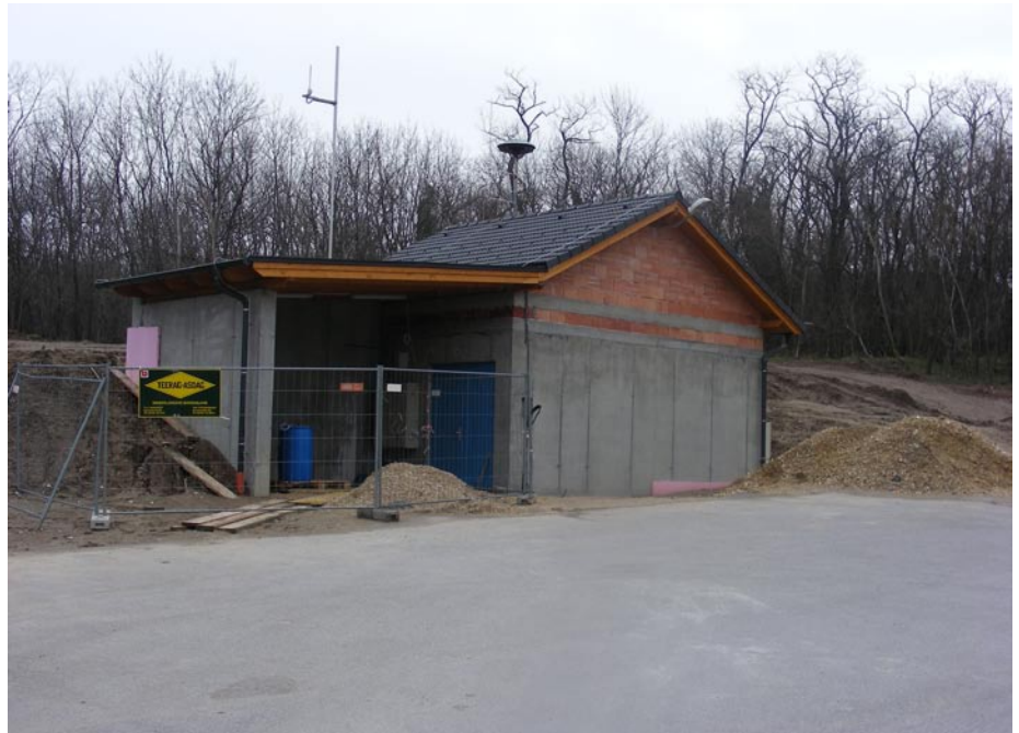
Unter diesem ebenfalls neu errichtetem Gebäude am Ende der Triftgasse befindet sich der neue Hochbehälter.

Mit der Fertigstellung der Wasserversorgung neu haben wir nicht nur eine Versorgung mit hoch-