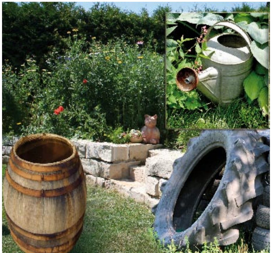
Offene Wasserfässer, vergessene Gießkannen, wassergefüllte Altreifen, vergammelte Vogeltränken, verlegte Dachrinnen und andere Wasseransammlungen sind für die Hausgelse ideale Brutmöglichkeiten. Durch Trockenlegen dieser Problemstellen können die ungeliebten Quälgeister eingedämmt werden.