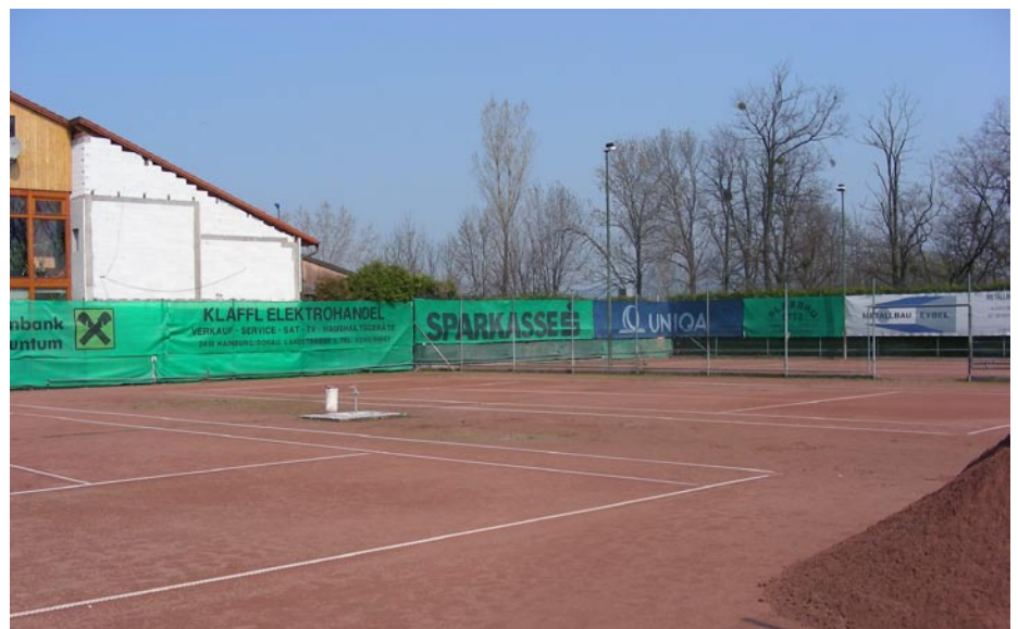
Der Tennisverein Wolfsthal verfügt über drei Tennisplätze, von denen einer auch über eine Fluglichtanlage verfügt

Der Tennisverein Wolfsthal ist also mehr als aktiv und hat eine wunderschöne Anlage – neue Mitglieder (besonders Jugendliche- aber natürlich auch gerne ältere Semester) werden jederzeit aufgenommen und sind herzlich willkommen!