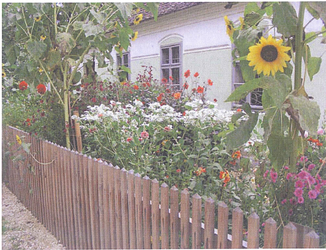
Historische Dorfarchitektur und typische Bauern- und Gemüsegärten bilden den Rahmen für ein Fest, das alle Sinne anspricht.