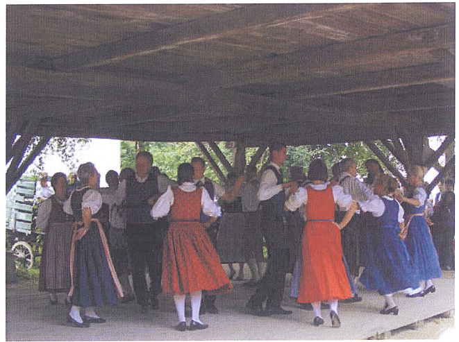
Das Rahmenprogramm bietet lebendige Volkskultur mit Musikensembles und Volkstanzgruppen aus ganz Niederösterreich, Musikern und Singen im Chor